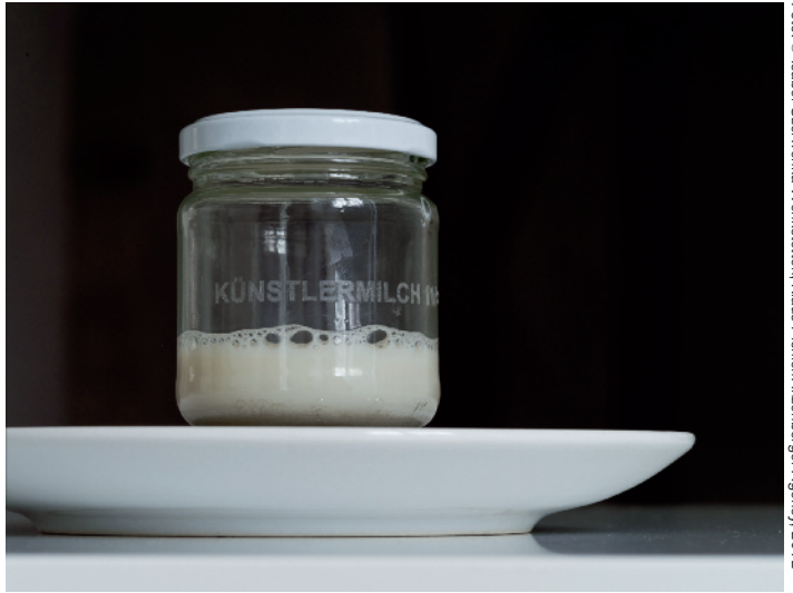
KÜNSTLERMILCH, Isabel Czerwenka-Wenkstetten, 2012