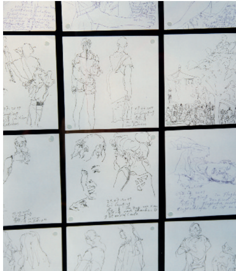
Zeichnungen, Li Cunqing, 2011–2013